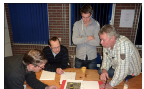
Overleg met tentenbedrijf Steenge

Verschillende werkgroepen zullen de komende maanden alle verbeteringen verder gaan uitwerken. Begin 2012 moet het totale programma en de deelnemerslijst bekend zijn. Dan zal ook de mogelijkheid worden geïntroduceerd om kaartjes en passe-partouts via de website van SIVO te kopen.