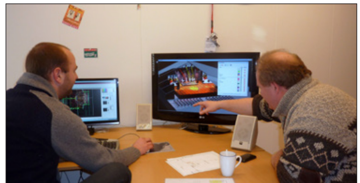
Addlight Boerema werken al aan SIVO 2012