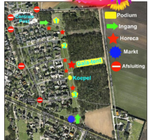
Nieuwe terreinindeling SIVO 2012

Uiteindelijk moeten al die aanpassingen er mede voor zorgen dat de bezoekers, jong en oud, de weg naar Odoorn weer weten te vinden en dat deelnemers uit de hele wereld in de rij blijven staan om in Drenthe hun nationale folklore voor het voetlicht te brengen. Maar het mes snijdt aan meerdere kanten. Wat betreft de organisatiekosten levert de nieuwe opzet tevens aanzienlijke besparingen op.